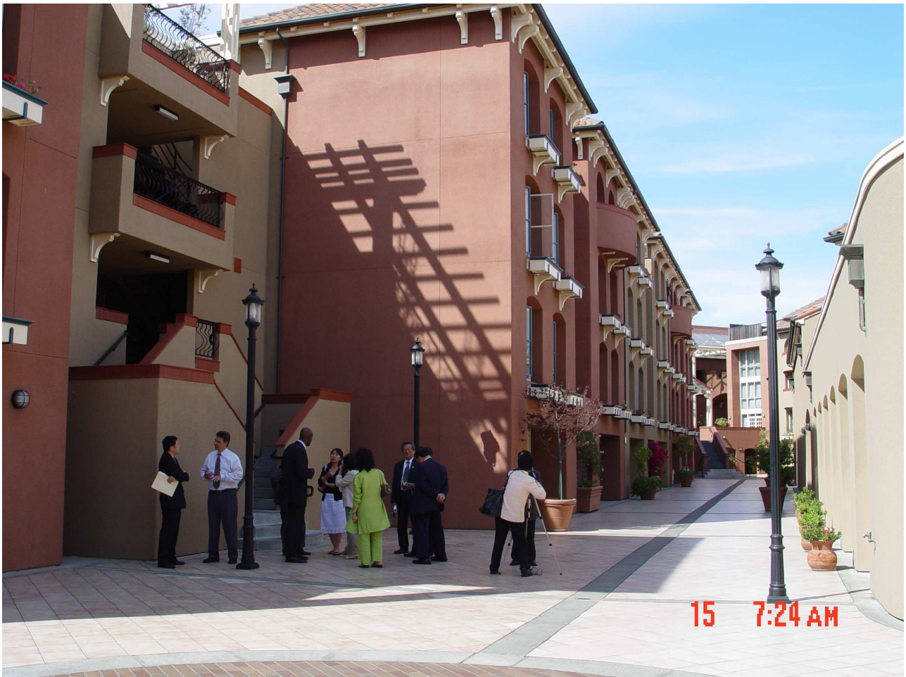
(圖一) 舊金山迪蘭西街基金會建造供更生人住居之連棟房屋

從前述訪美的心得，及保護司推動各項業務的努力，我們期待的是改變更生人與犯罪被害人的世界——走出黑暗，亮起明燈，但這不是保護司盡力就可以完成的心願，而必須靠每一位更生人、犯罪被害人、社會大眾及你我共同的努力才能完成，我期待藉由訪美心得的闡述，與大家的回應，讓所有更生人與犯罪被害人的心路走得更順利更美好。