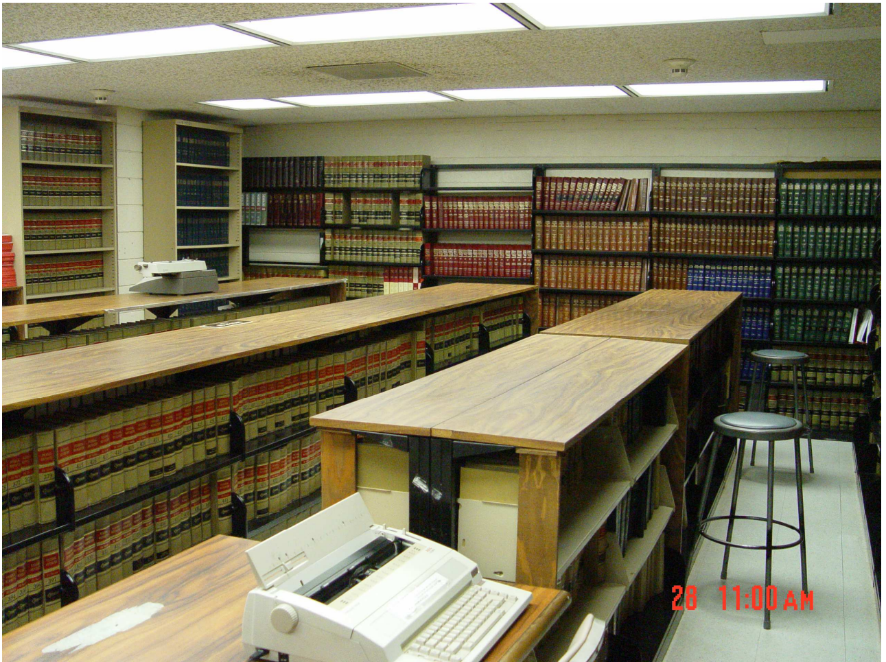
(圖七) 歐胡島社區矯正中心監獄內的圖書室