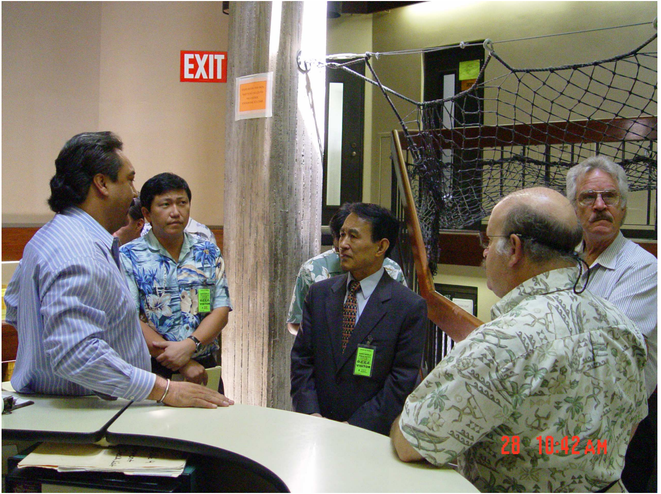
(圖六) 歐胡島社區矯正中心的監獄內為精神病患收容人設置的防護網