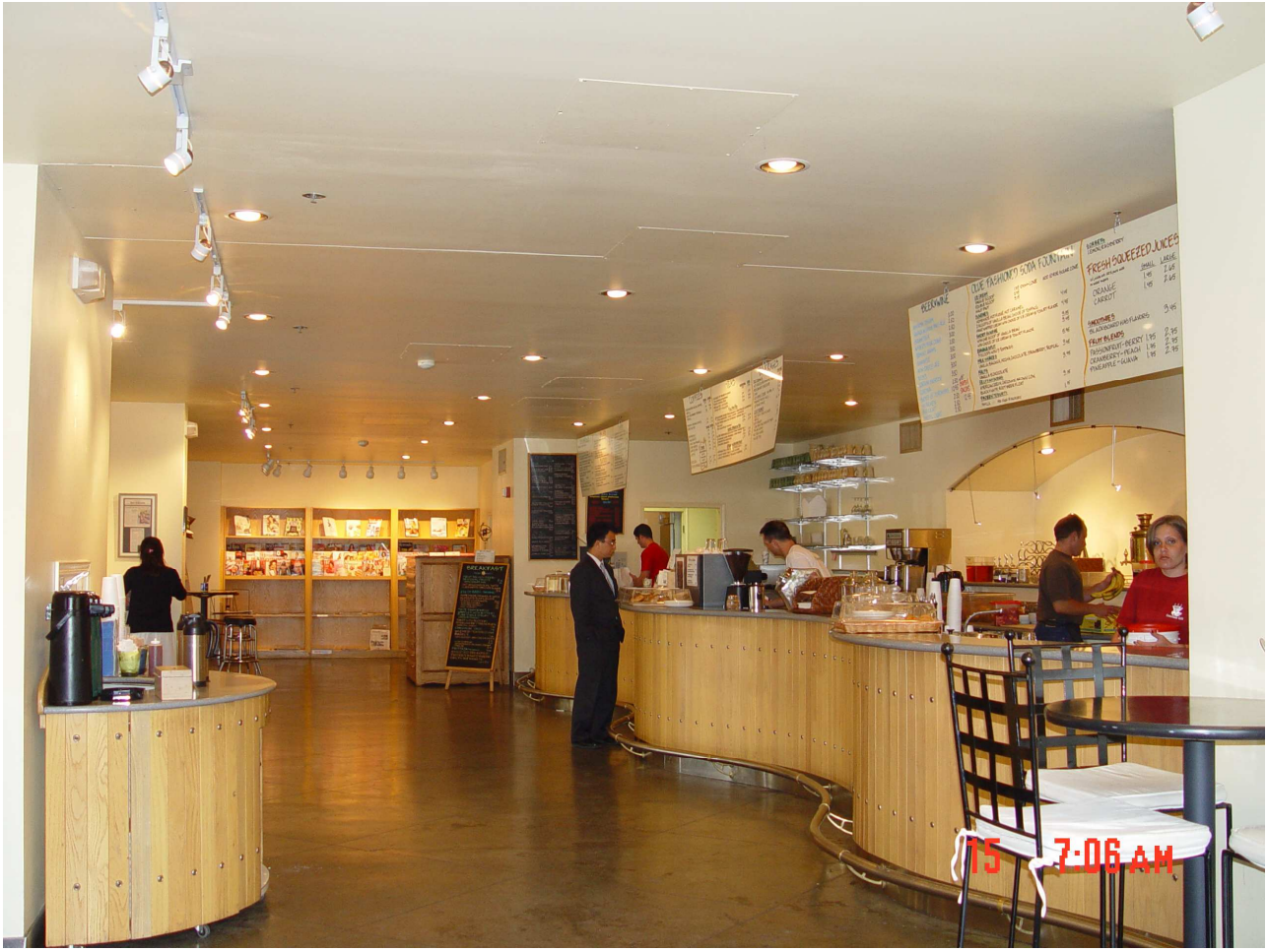
(圖三) 舊金山迪蘭西街基金會內的餐廳