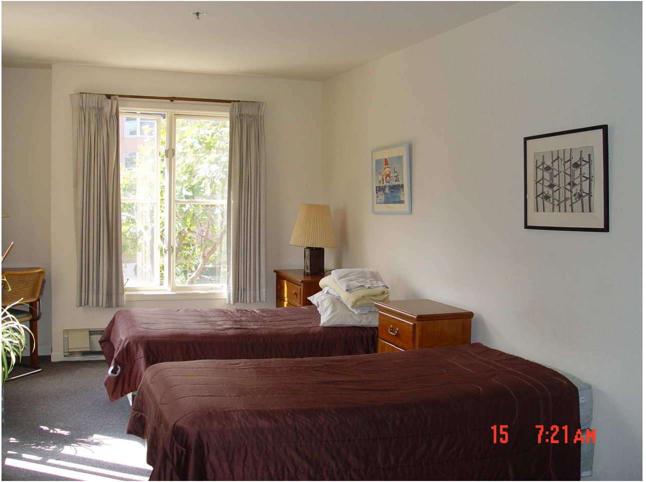
(圖二) 舊金山迪蘭西街基金會建造供更生人居住的臥室